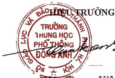
Hữu Trung Kiên